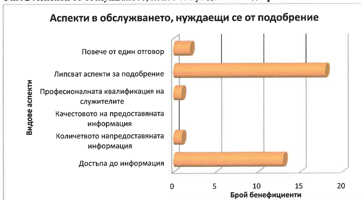
Фиг. 2 Аспекти от обслужването, които се нуждаят от подобрене :

6. По отношение образованието на гражданите, попълнили анкетния формуляр - 63% са с висше образование, 37% са със средно. 66% от подалите информация са работещи, 14 % са работодатели, 14% са пенсионери и 6% са безработни.