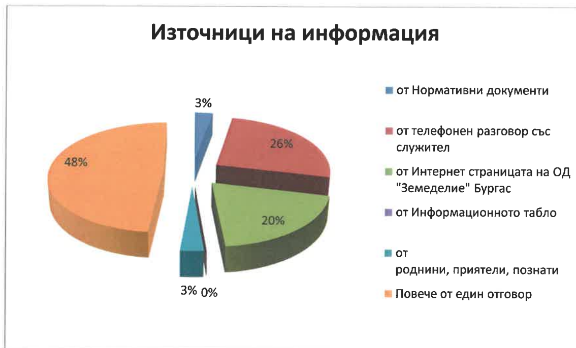
Фиг. 1 Източници на първоначална информация

3. По отношение качеството на предоставяне на информацията от служителите на ОД „Земеделие“ Бургас – 40 % от анкетираните потвърждават, че получената информация е достъпна. 29 % са посочили, че информацията е изчерпателна. 17% от анкетираните се са дали повече от един положителен отговор и 14 % са определили, че получената информация е разбираема.