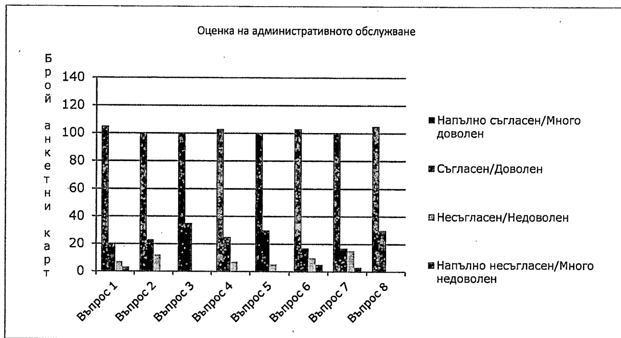
Фигура 1: Оценка на административното обслужване.

получената информация по отношение на спазването на сроковете за извършване на заявените административни услуги, професионалната подготовка, бързината и качеството на обслужване на потребителите от страна на служителите в министерството. Отговорите на потребителите на административни услуги по поставените в анкетата въпроси са обобщени в диаграма (Фиг. 1).